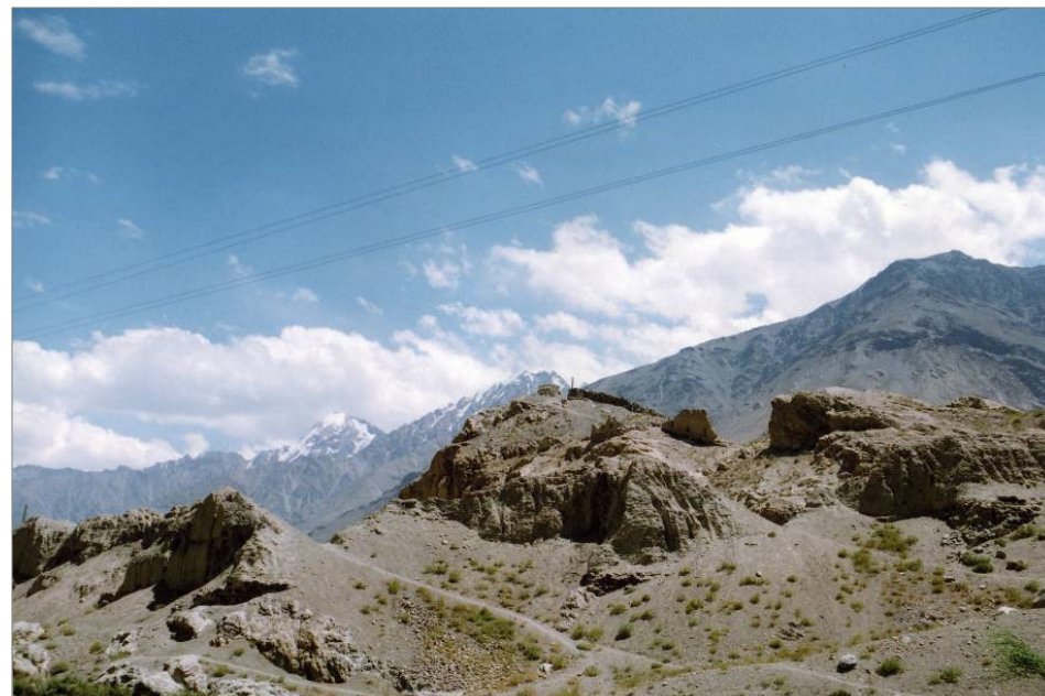
Крепость Каахка называется так по имени легендарного богатыря, царя сияхпушей-огнепоклонников.

Остатки этой древней глиняной крепости IV века нашей эры высятся на скалистой возвышенности, на берегу реки Пяндж, где в него впадает со стороны Афганистана многоводный приток. Обрывистые склоны постепенно снижаются, и этот гребень обведен по краям стеной, сложенной из сырцового кирпича на каменном фундаменте. Эрозия сильно разрушила стены с внутренней стороны крепости, но снаружи они представляют собой довольно мощное сооружение с многочисленными башнями и можно себе представить, какой неприступной и грозной казалась она в древности, закрывая собою пути вниз по Пянджу, в сторону Ишкашима, и вверх через Гиндукуш — тропу к перевалу от устья притока, где ныне раскинулся живописный афганский кишлак Иштарг.